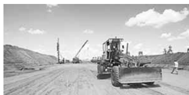
- привел он пример.

Строительство в Беларуси бетонных дорог положительно скажется на финансовых результатах отечественных цементных заводов. Такое мнение высказал заместитель премьер-министра Беларуси Анатолий Калинин.