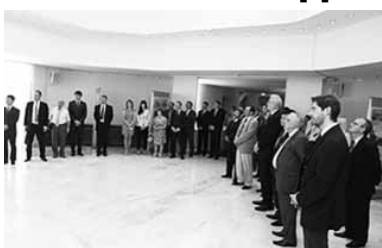
информации Лилия Ананич, проект имеет 10-летнюю историю