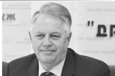
3-5% для реального производителя в Украине.

Третье: мы настаиваем, чтобы были приняты меры по защите интересов украинцев. Речь идет о пакете из 150-ти законопроектов, внесенном КПУ в парламент. В частности о возвращении в государственную собственность базовых отраслей промышленности и крупнейших предприятий. Мы также требуем отменить налог на добавленную стоимость и заменить его налогом с оборота. Помимо этого, КПУ настаивает на принятии решений о банковской системе, предоставлении кредитов под