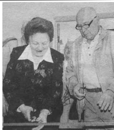
воспитания подрастающего поколения.