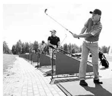
мира по гольфу, участие гольфа в Олимпийских играх и в различных мероприятиях, способствующих развитию игры по всему миру.

Федерации гольфа Беларуси стала 126-м членом IGF, которая объединяет около 60 млн гольфистов. Основным критерием принятия той или иной страны в состав IGF является активная деятельность по развитию гольфа на ее территории, с обязательным условием признания федерации национальным олимпийским комитетом. Помощник исполнительного директора IGF Эурелия Таччини сообщила 11 июля о членстве Беларуси в международной организации. Документы, подтверждающие настоящий факт, должны быть вскоре переданы из швейцарской Лозаны в Минск. Основным направлением деятельности IGF является проведение один раз в два года командных чемпионатов