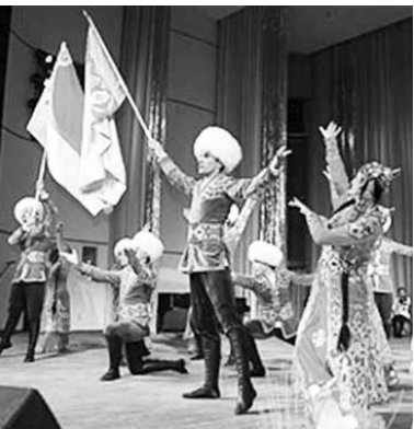
По материалам БЕЛТА

«Обмен гастролями — добрая традиция, которую мы намерены продолжать. Однако сейчас решено разработать программу, в которой оговоривалось бы взаимодействие между конкретными учреждениями и организациями культуры двух стран на постоянной основе, а не только во время гастролей. Хочется поднять статус этого документа и видеть его на правительственном уровне», — добавил министр.