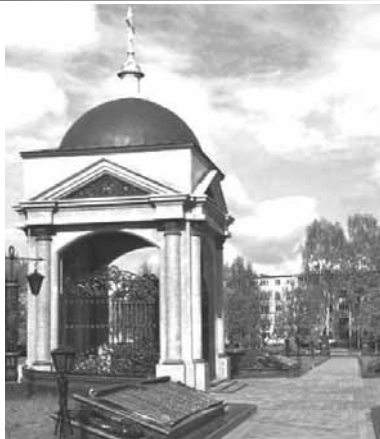
отмечен День Памяти павших в Первой мировой войне.

Кстати, 14 августа 2011 года в Минске было возрождено Минское Братское кладбище героев Первой мировой войны, основанное в ноябре 1914 года и закрытое в 1932 году. На кладбище воздвигнута каменная часовня (см. на фото), рядом с которой размещены бронзовые плиты с именами 2500 похороненных на кладбище офицеров и солдат русской армии. 11 ноября 2011 года на кладбище был впервые