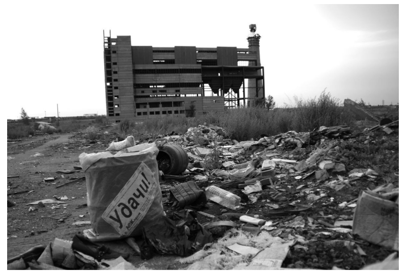
Такие «пейзажи» на Украине встречаются все чаще

Состояние в социальной сфере красноречиво характеризуют и такие данные. Как