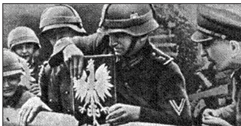
Фашисты уничтожают пограничный знак Польши

«От караульных помещений, так же, как и от бывших конюшен, в которых размещены военнопленные, исходит тошнотворный запах. Пленные зябко жмутся вокруг импровизированной печки, где горят несколько поленьев, — единственный способ обогрева. Ночью, укрываясь от первых холодов, они тесными рядами укладываются группами по 300 человек в плохо освещённых и плохо