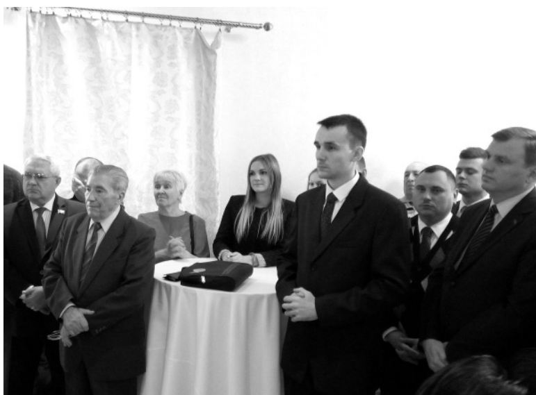
(Окончание, начало на стр. 1)

Мы последовательно выступаем за активное развитие отношения дружбы и сотрудничества с Республикой Беларусь в различных областях в интересах народов наших стран, и искренне желаем белорусскому народу больших успехов в