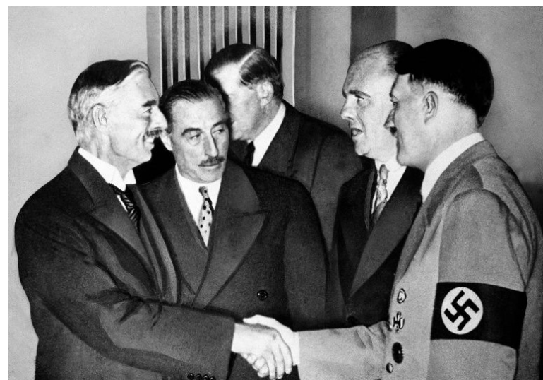
Адольф Гитлер и премьер Великобритании Невилл Чемберлен в момент подписания «пакта Гитлера – Чемберлена», 30.09.1938

Так оно и было. Допустим, не подписал бы СССР этот документ. И что, Гитлер не напал бы на Польшу? Напал бы! Он так еще в апреле решил. Германия гарантировано напала бы на Польшу и быстро ее разгромила. Затем вставал бы вопрос о территории западных Украины и Беларуси. Если бы они не отошли