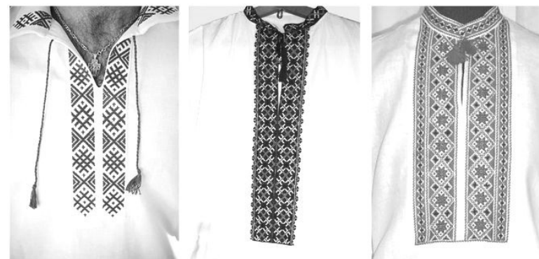
Сравните сами — белорусская, русская и украинская вышиванки

Но все-таки пока вышиванка остается весьма политизированным атрибутом одежды, по которым на улице можно определить «вышиватника», «свядомого» или «змагара», что в общем-то одно и то же. Но аполитизировать народную одежду, в которой веками