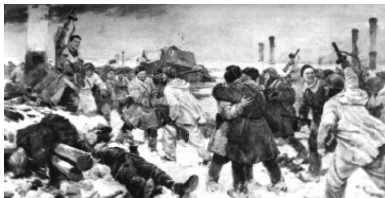
Картина «Встреча воинов Волховского и Ленинградского фронтов»

Верховный Главнокомандующий И.В. Сталин поздравил бойцов, командиров и политработников Волховского