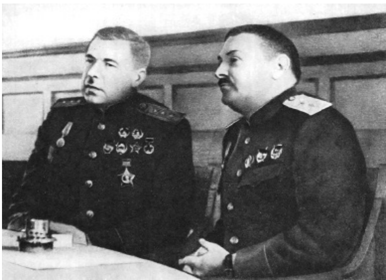
Л.А. Говоров и А.А. Жданов, январь 1943 г.