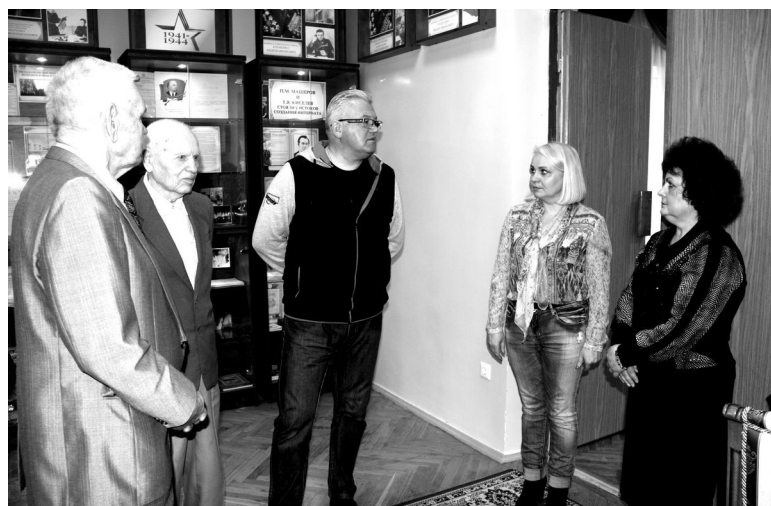
Первый секретарь ЦК КПБ посещает Ждановичский интернат