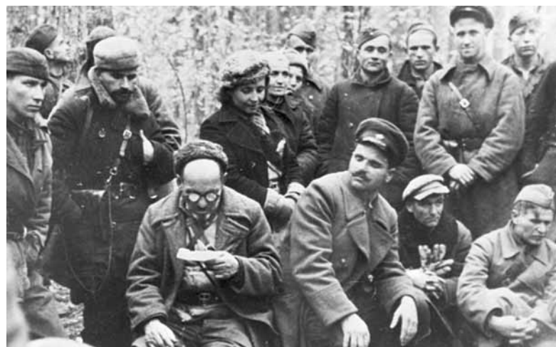
Ковпак (сидит слева) зачитывает партизанам шифровку с Большой земли. Комиссар отряда С. В. Руднев (сидит справа), 1942 г.

ского пехотного полка Сидор Ковпак был отважным воином. Будучи несколько раз раненным, он всегда возвращался в строй. В 1916 году, будучи разведчиком, Ковпак особо отличился во время Брусилловского прорыва. Своими подвигами он заслужил два Георгиевских креста, которые ему вручил император Николай II.