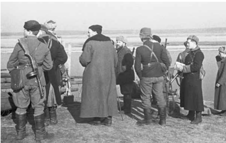
Сидор Ковпак (в центре) обсуждает с командирами отрядов детали боевой операции, 1942 г. Идет Ковпак!

Но Ковпак был совершенно иным. За плечами - огромный военный опыт, объединенный