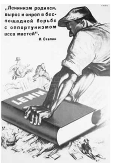
„Ленинизм родился, вырос и окреп в беспощадной борьбе с оппортунизмом всех мастей“. И. Сталин

По завершению отчетно-выборного собрания необходимо обобщить поступившие критические замечания и предложения членов партии, спланировать работу по их реализации.