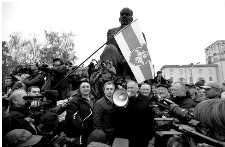
Колас хмуро взирает на «полицейскую» символику, с которой был знаком не понаслышке

25 марта 2016 на День воли участники шествия прибыли на площадь Якуба Коласа, где возложили цветы к памятнику. Здесь же произошел короткий митинг: выступил Статкевич, который назвал Коласа