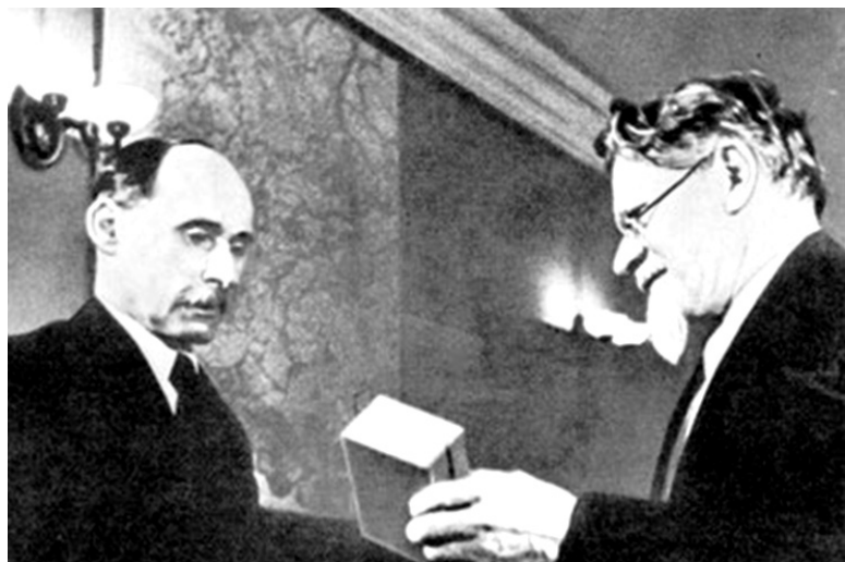
Калинин вручает Коласу орден Ленина

акрэсліў дарогі У новую праўду зямлі. На гонях раскутых, на нівах каласных Ляжыць яго праўды пячаць, І мудрыя словы так проста і ясна, Як вечныя песні, гучаць. Гучаць яны ў шуме, дзе плынь маладая Разгортвае сілы ўглыб, шыр. У песнях і думках бязмежнага края, Як сонца, жыве правадыр. Жыве ён у гомане-гудзе заводаў, У ясных крамлёўскіх агнях, У нашым яднанні, у дружбе народаў І ў партыі зоркіх вачах. Жыве ён з Чырвонаю Арміяй нашай І дзельці паходы яе, І сэрцу героя, і волі бясстрашных Імя яго сілу дае. Між нас жыве Ленін, як сонца, як зоры, Як мудрасць вялікай зямлі, І сее праменні, агні непакоры, Каб людзі шчасліва жылі.