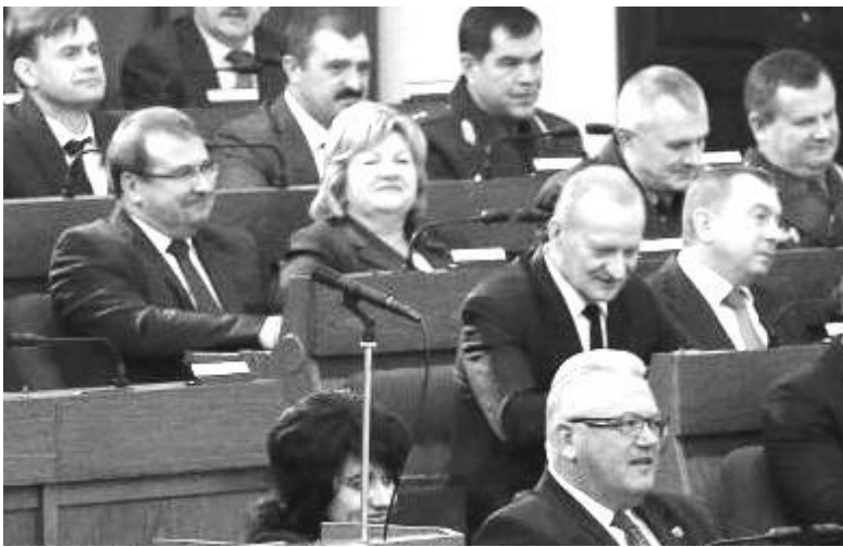
(Окончание. Начало на стр. 1)