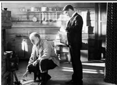
ветский экран» фильм был признан лучшей комедией 1984 года.

Картина «Белые Росы. Возвращение» является продолжением одной из самых известных работ «Беларусьфильма» - кинокомедии «Белые Росы». В год выхода на киноэкраны (1983) она вошла в список лидеров проката, собрав 36 млн зрителей. По результатам опроса журнала «Со-