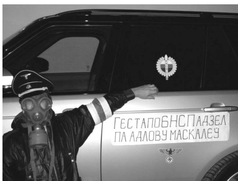
Радикал не нужен выстроенной системе и компрометирует ее

С одной стороны, большинство лидеров руководят партийными структурами бесценно по 10 и более лет; им необходимо как-то встраивать в игру подрастающую резвую молодежь и при этом не терять