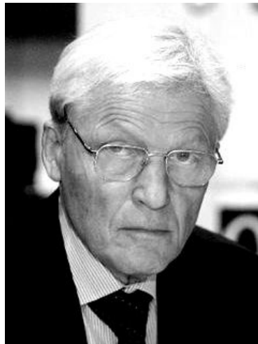
Ханс-Георг Вик, экс-президент Федеральной разведывательной службы Германии (1985-1990)

Давным-давно, во времена усобицы, оппозиция была сильнее и радикальнее, а вожак каждой оппозиционной группировки видел себя ни много ни мало — президентом. Партийные князьки боролись между собой, интриговали, и ни о каком «едином кандидате» на выборах не могло быть и речи, но...