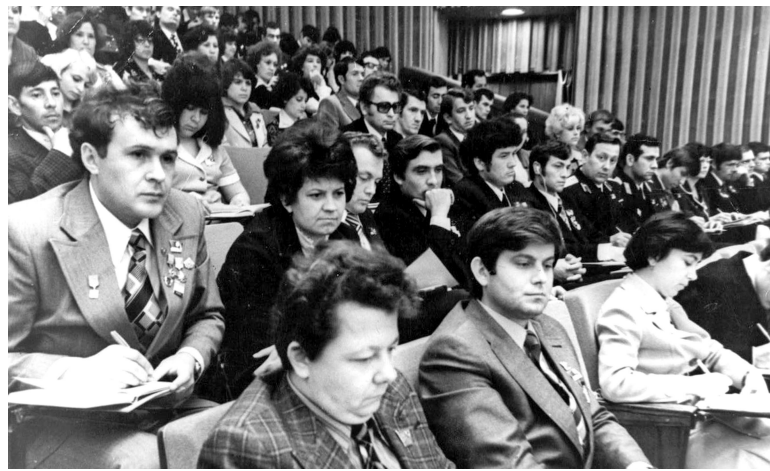
На XVIII Съезде ВЛКСМ. Ростовская организация

На вечере в Кремлевском Дворце съездов народной артистки СССР «комсомольского» композитора Алексан-