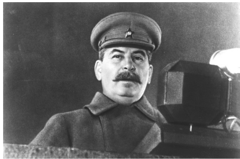
Иосиф СТАЛИН на трибуне

Торжественный марш открыл сводный батальон курсантов 1-го Московского Краснознаменного артиллерийского училища имени Л.Б. Красина. В параде приняли участие батальоны курсантов других военных училищ, НКВД, стрелковые, кавалерийские и танковые подразделения, отряды вооруженных рабочих города Москвы, моряки, эскадроны кавалерии... Этих людей, идущих по Красной площади, вскормила Советская Родина, выпестовала партия большевиков, вдохновил на ратные подвиги товарищ Сталин. В Центральном архиве Минобороны Российской Федерации хранится справка-доклад коменданта города Москвы. Из этого документа