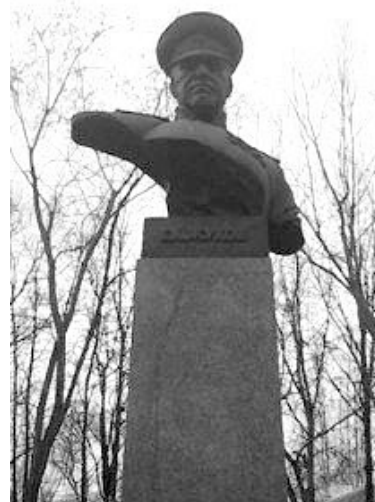
Памятник Г.К. Жукову в Минске