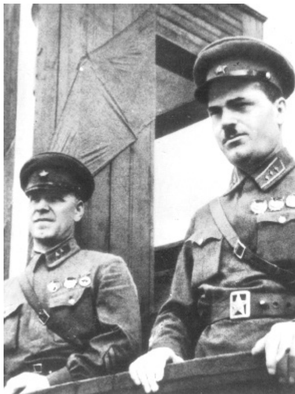
Комдив Г.К. Жуков на учениях в Белорусском военном округе

Халхин-Гол, а также довоенной службы в Белорусском особом военном округе. Его скульптурный портрет работы народного художника СССР белорусского скульптора З.И. Азгура мы видим возле зала №5 «Коренной перелом. Советский тыл». Портреты маршала – в темах «Оборона Ленинграда», «Берлинская операция», его образ представлен в картине белорусского художника Е.Н. Тихановича «Подписание Акта о капитуляции Германии», а