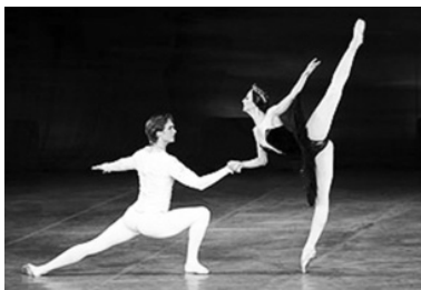
шого театра Беларуси.

Гастроли продлятся завершатся 21 января. За это время артисты 15 раз покажут европейской публике «Лебединое озеро» и 18 раз исполнят балет «Щелкунчик, или Еще одна Рождественская история». В главных партиях в спектаклях выступают ведущие солисты балетной труппы Большого театра Беларуси.