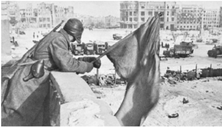
Знамя над площадью Павших бойцов, январь 1943

ультиматум принят не был. И тогда, в период с 10 января по 2 февраля 1943 г. войсками Донского фронта была осуществлена заключительная операция сражения под Сталинградом «Кольцо», замысел которой заключался в том, чтобы ударами с запада на восток рассеять окруженные войска на изолированные части и уничтожить их порознь.