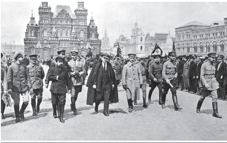
В.И. Ленин на параде частей Всеобуча в Москве, май 1919 г.