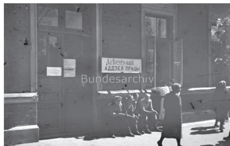
Bild 214-49 1941 Sommer

Как писал архитектор А.А. Воинов: «Реализация генерального плана и началась с восстановления сгоревших коробок зданий. Однако отстраивалось не все подряд, а только те здания, которые вообще поддавались восстановлению и не мешали в дальнейшем реконструкции города. Эта