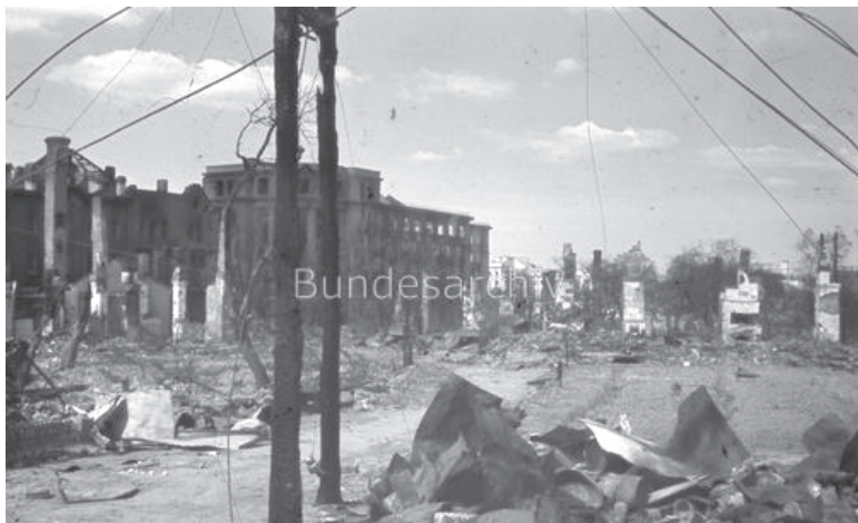
Bundesarchiv, Bild 214-24 Foto: Lohmann, Curt | 1941 Sommer

Фотоматериалов о расстреле нет в наличии, хотя картина частично может быть восстановлена благодаря сохранившимся показаниям на суде начальника личного штаба Г. Гиммлера Карла Вольфа, присутствовавшего на казни. В частности, из них следует, что заключенных ударами