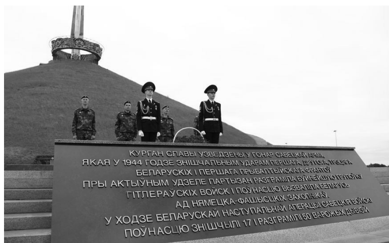
Курган святой и обновлённый... Четыре бронзовых штыка

5 июля 1969 года, 55 лет назад, был открыт Курган Славы – мемориальный комплекс в память воинов 1, 2, 3-го Белорусских и 1-го Прибалтийского фронтов в Белорусской стратегической наступательной операции «Багратион». Воин-интернационалист белорусский поэт Григорий Соколовский написал в стихотворении «Курган Славы» такие замечательные слова: