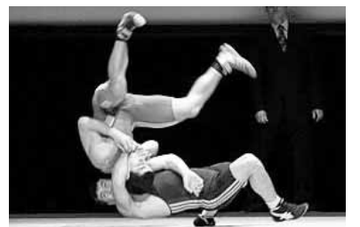
вые Игры современности.

Рассмотрев презентации спортивной борьбы, бейсбола и сквоша, претендовавших на единственное вакантное место в программе Олимпийских игр 2020 года, члены МОК отдали предпочтение борьбе, получившей уже в первом круге 49 голосов. За бейсбол было подано 24 голоса, а за сквош - 22. Борьба представлена на Олимпиадах с 1896 года, когда в Афинах были проведены пер-