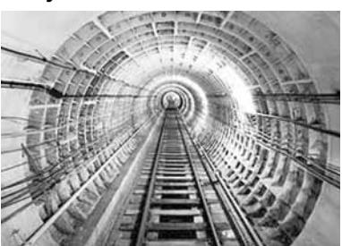
«К 9 мая откроется станция ме-